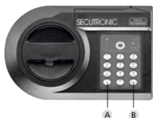
Structuur van slot A